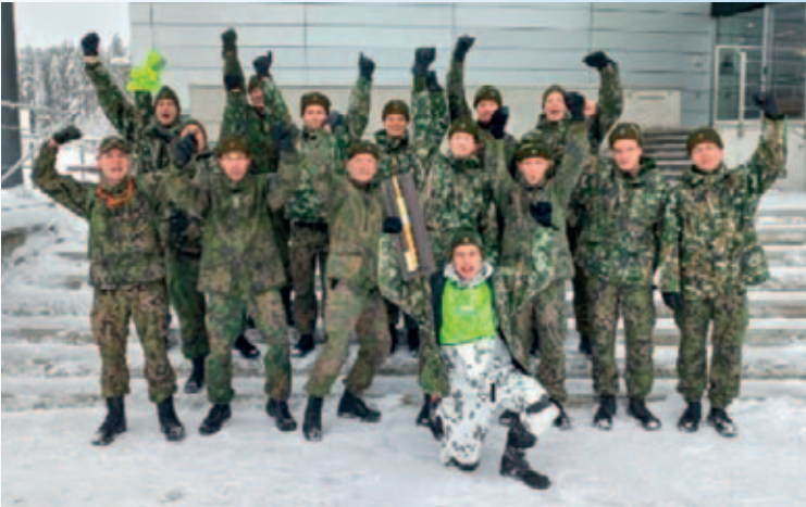
Vuoden 2022 Oltermanni hiihdossa voitto jälleen Suur-Savon Reserviläispiirille

Harjoitustoiminnassa aluetoimiston painopiste tänä vuonna on syksyllä 2022 alueellamme toimeenpantavassa paikallispuolustusharjoituksessa. Harjoituksen johtaa Karjalan prikaatin apulauskomentaja. Valmistelut ovat jo pitkällä ja saamme varmasti erinomaisen harjoituskokonaisuuden toteutettua Savonlinnan seudulla. Aluetoimiston keskeisenä tavoitteena on kehittää harjoituksessa Etelä-Savon paikallispuolustusjoukkojen kykyä toimia tehtävissään. Lisäksi harjoitus kehittää Etelä-Savon alueen viranomaisyhteistoiminnan ja eri yhteistoimintaosapuolten välistä suunnittelua, johtamista, toimeenpanoa ja alueen viranomaisten yhteistä viestintää. Erinomaisen hyvin alueen toimijat ovat harjoitukseen sitoutumassa. Paikallispuolustusharjoitushan onkin erinomainen mahdollisuus alueemme viranomaisille ja kunnille alueellisesti harjaantua kokonaisturvallisuuden tehtäväkentässä. Harjoitus kehittää meidän kaikkien kykyä turvata alueellamme yhteiskunnan elintärkeitä toimintoja ja kansalaisten turvallista elämää.