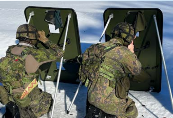
Sirotemiinojen raivaaminen ampumalla