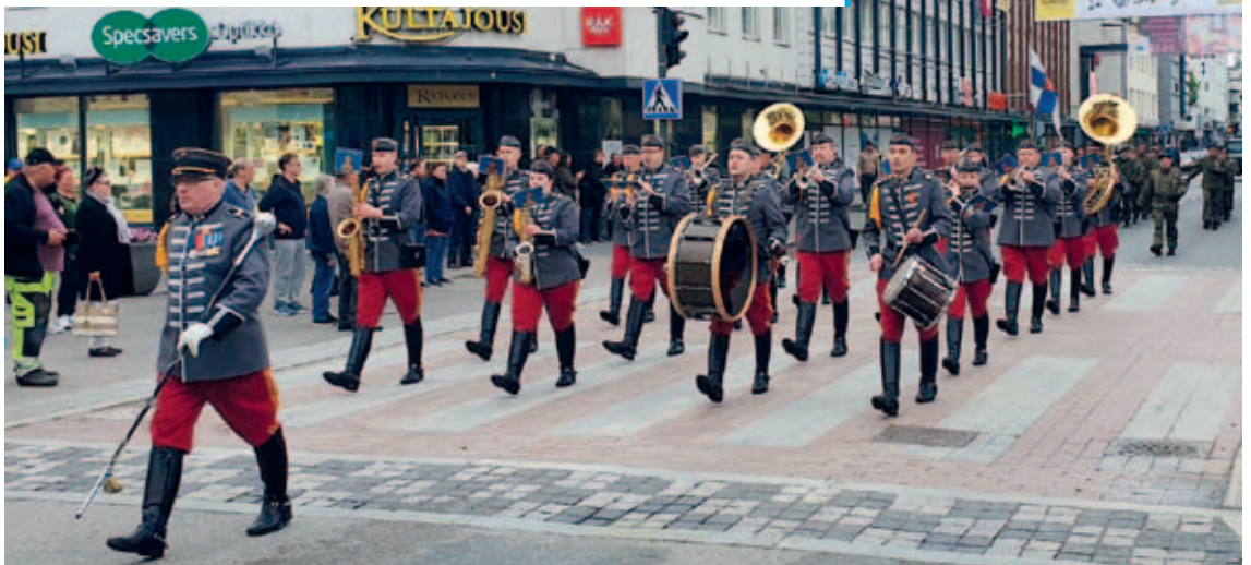
Vartioparaatin edessä marssi Rakuunasoittokunta.