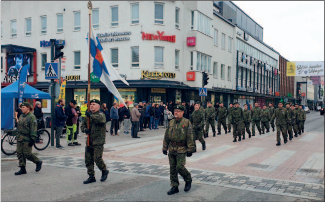
Suur-Savon Reservipiirien muodostama paraatiosasto marssi ryhdikkäästi.